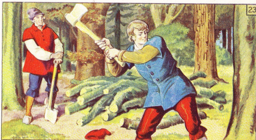
Hij gaf een geweldige houw tegen de boom.

„Och, domme jongen,” schold de vader, „wat wil jij betalen. Je hebt zelf geen geld en alles wat je hebt, moet ik je geven; dat zijn van die schooljongenspraatjes, maar van